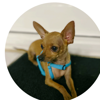
Samy Mascotte du centre